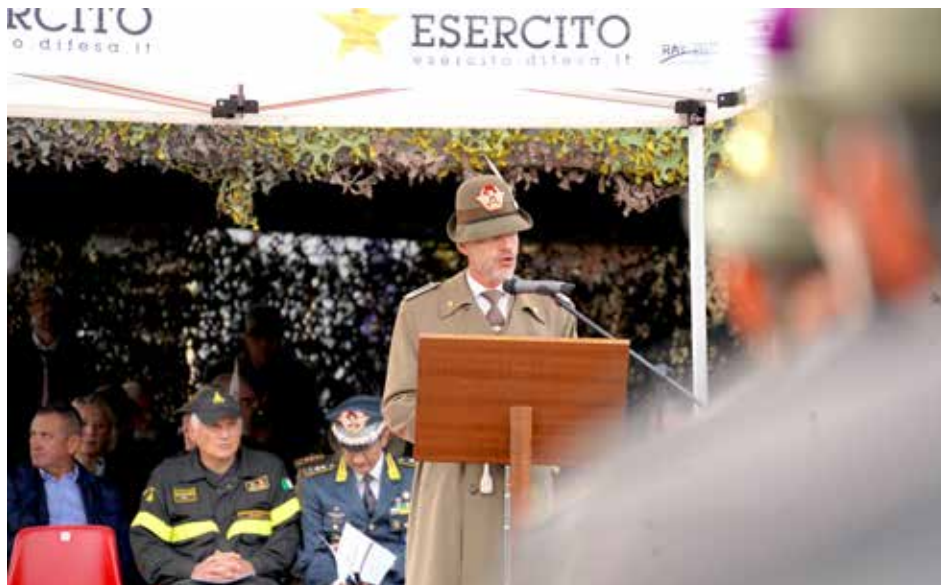
Il cedente Gen. Fontana parla agli alpini schierati

Di rilievo anche l'attività dei nuclei per la sicurezza in montagna nei comprensori sciistici e il monitoraggio meteo-nivologico effettuato dagli operatori del servizio Meteomont sull'arco alpino e appenninico.