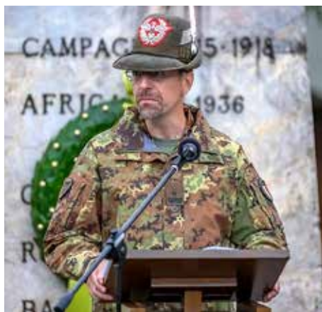
Generale di Brigata Francesco Maioriello

ostile, fortemente compartimentato, caratterizzato dalla presenza di difficili ostacoli verticali ed in condizioni climatiche critiche specialmente nel periodo ambientale invernale e ad alte quote.