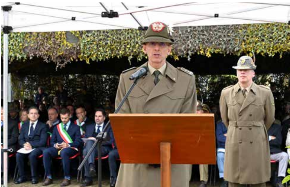
Il Comandante delle Truppe Alpine durante il suo discorso