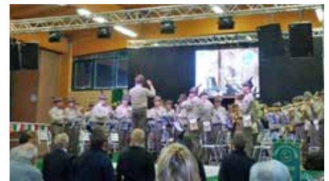
Concerto Fanfara Ivrea

Venerdì 21 aprile, il "Concerto Penne e Piume", con la partecipazione della Fanfara ANA di Ivrea e della Fanfara dei Bersaglieri di Asti, che, alternandosi sul palco del Polivalente hanno raccolto il plauso unanime del numeroso pubblico.