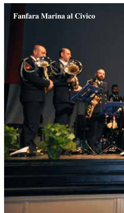
Fanfara Marina al Civico