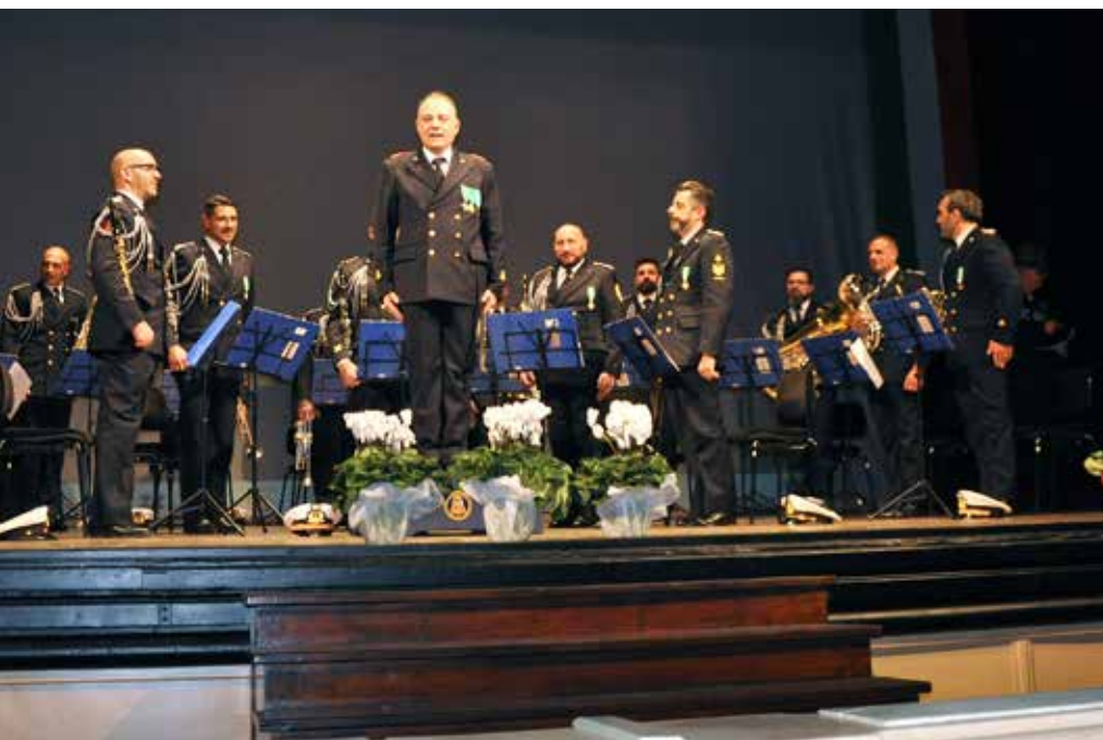
Fanfara di Presidio del Comando Marittimo Nord di La Spezia