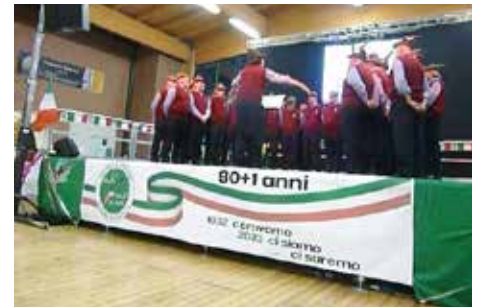
Coro Alpini del Rosa