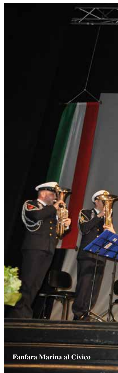
Fanfara Marina al Civico

Il concerto, iniziato con il Canto degli Italiani, non poteva che concludersi con l'inno della Marina ed il nostro Trentatré.