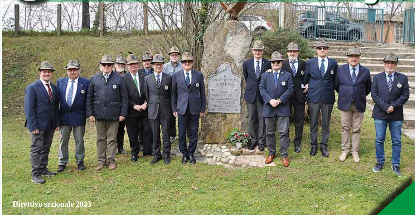
Direttivo sezionale 2023