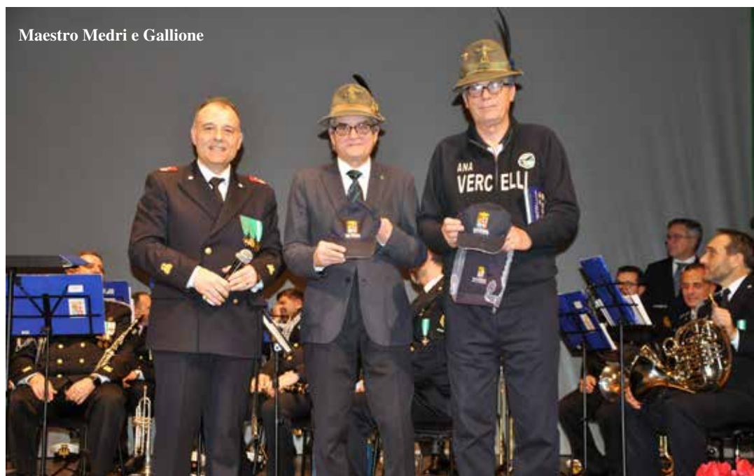
Maestro Medri e Gallione